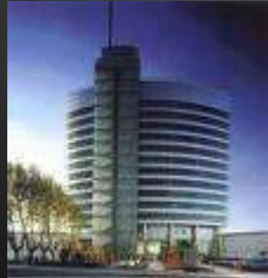
HOK International LTD, St. Louis.