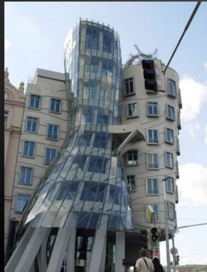
CASA DANZANTE, PRAGA FRANK OWEN GEHRY