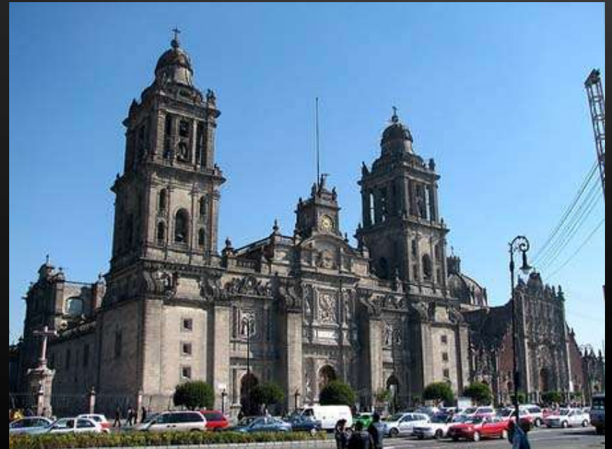
CATEDRAL METROPOLITANA DE MÉXICO