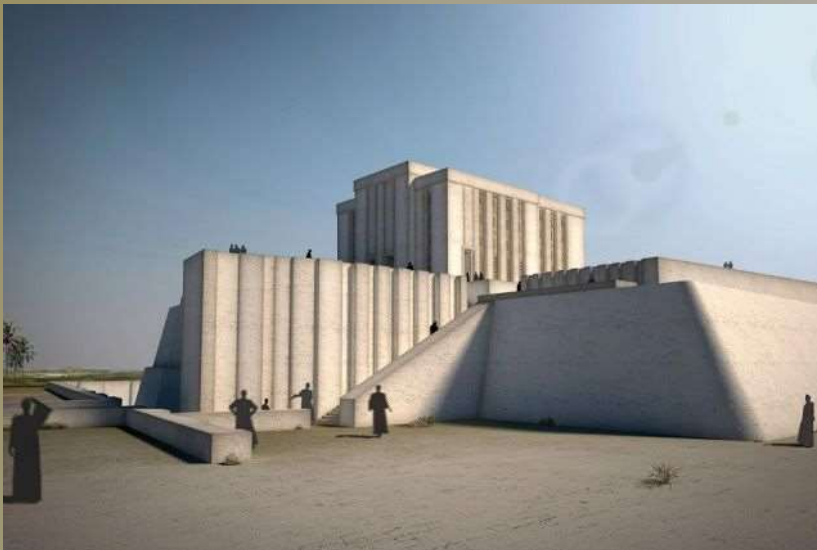
Reconstrucción virtual del Templo Blanco de Uruk, tal como debía mostrarse 3 200 años aC.