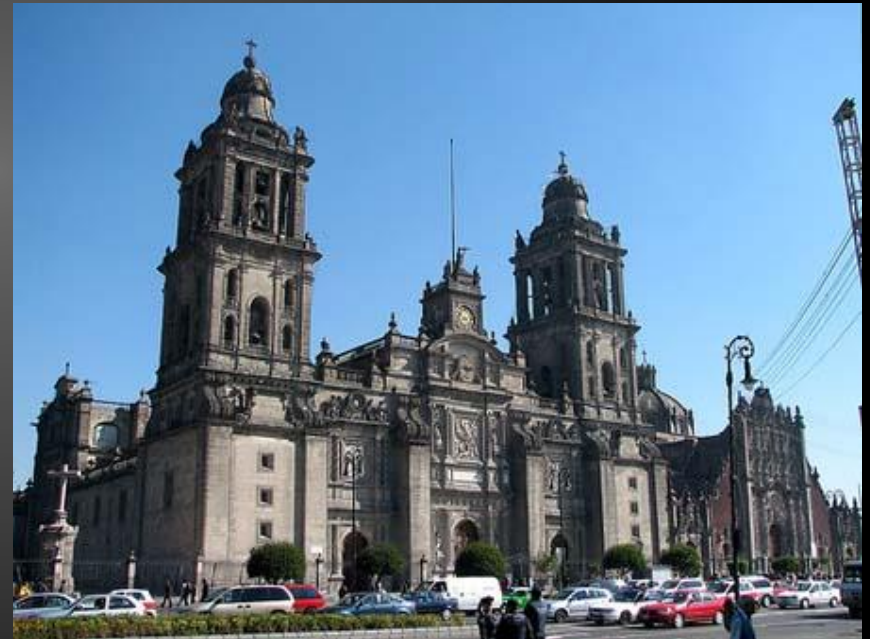
CATEDRAL METROPOLITANA DE MÉXICO