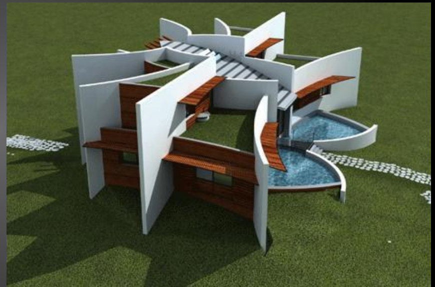
Proyecto de Arquitectura sostenible