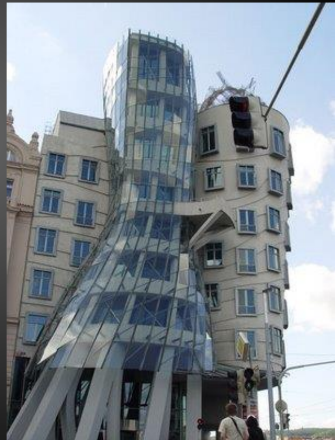
CASA DANZANTE, PRAGA FRANK OWEN GEHRY