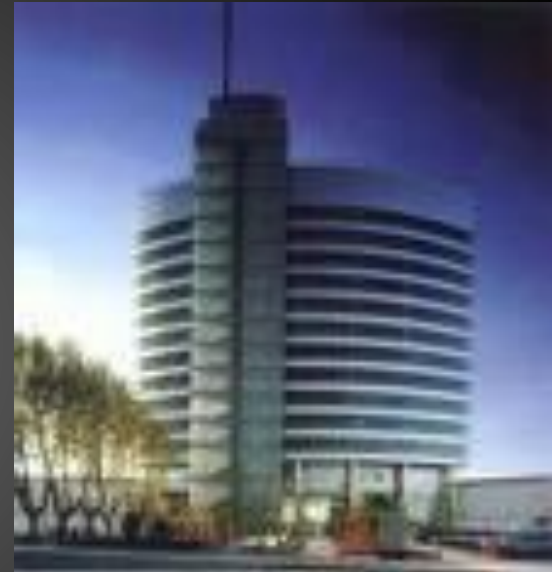
HOK International LTD, St. Louis.